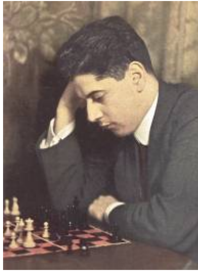
José Raúl Capablanca 1912

Draufhin schrieb etwas später José Raúl Capablanca