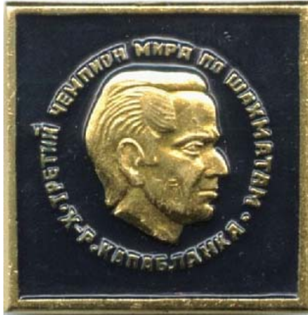
José Raúl Capablanca

Diese Medaillen wurden von den russischen Organisatoren für die treue Teilnahme beider Spieler an den Moskauer Turnieren angefertigt und als Zeichen ihrer Freundschaft gedeutet, die bis an das Ende ihrer Leben 1941 bzw. 1942 dauerte.