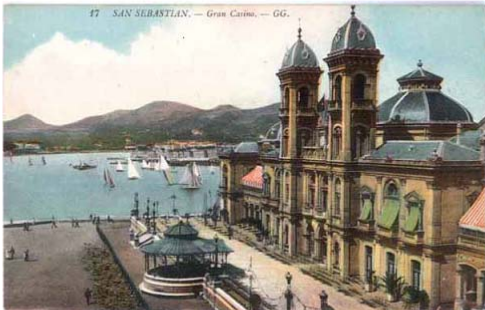
Gran Casino de San Sebastián 1911 Turniergebäude

vor Rubinstein und Vidmar gewann, allerdings ohne Teilnahme von Dr. Emanuel Lasker, erklärte sich Capablanca als rechtmässiger Anwärter zum Weltmeisterschaftskampf gegen Dr. Emanuel Lasker.