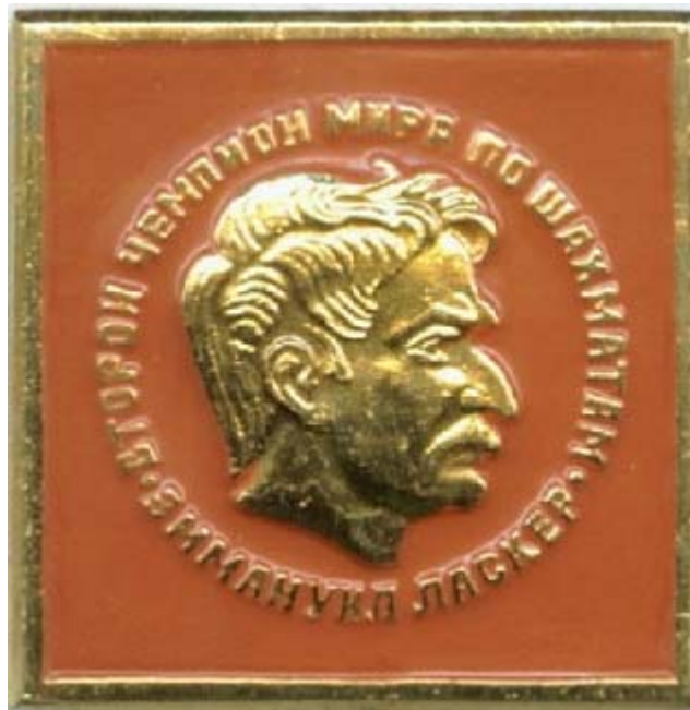
Dr. Emanuel Lasker

Letztlich stellen wir den geneigten Lesern sogar die Abbildungen zweier russischer Medaillen vor, die beide Spieler zeigen: