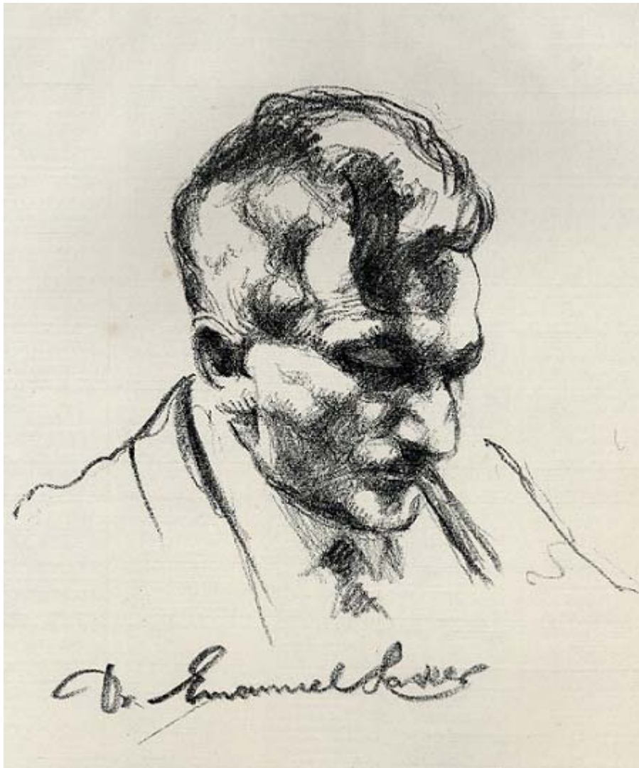
Dr. Emanuel Lasker